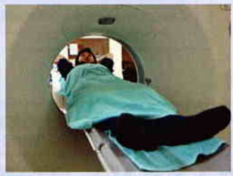
64列マルチスライスCT

狭心症や心筋梗塞などの虚血性心疾患は、症状が出て初めてわかることが多いのです。心臓は動く臓器ですので、従来の撮影器機では心臓の冠動脈を簡単かつ鮮明に撮影することはできませんでした。そのためにも心臓カテーテル検査は有効な検査ですが、この検査は入院が必要で、痛みを少なからず与え身体的にも時間的にも負担が掛かります。これらのことを解決したのが、「64列マルチスライスCT」による検査です。このマルチCTでは、入院の必要は無く、たった10~15秒間の息止めで、心臓全体を撮影することができるようになりました。この検査を中心にした「心臓ドック」は冠動脈疾患の早期発見に大きく役立ちます。